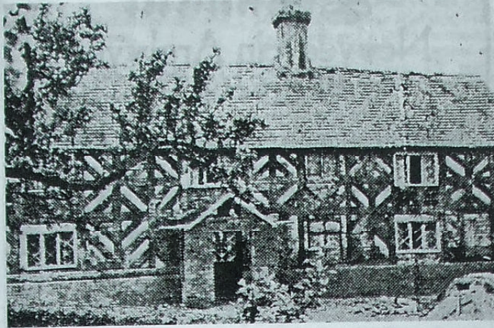
Fferm FFYNOGION — ac isod, Puleston