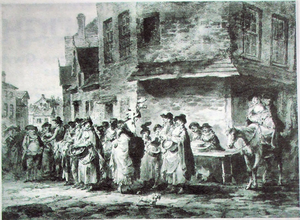
Llun o farchnad yng Nghymru.

Ond bu'n rhaid aros hyd yn gymharol ddiweddar am gyfieithiad Cymraeg safonol ond, mae'r un a gafwyd gan Thomas Jones yn 1938 yn sylweddol well na'r un Saesneg ac yn ddarllen difyr iawn.