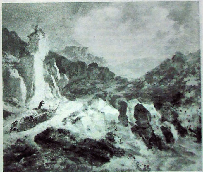
Llun o fflach mellten yn Aberglaslyn. Darlun trwy ganiatâd Oriol Dinas Leeds.

Gall dyfalu lle yn union a gyfleir gan arlunydd fod yn ymarferiad di-bwrpas ond credaf y gellir ystyried lluniau Ibbetson fel cofnod pur gwir o'r hyn a welodd a bod gwerth ychwanegol iddynt oherwydd hynny.