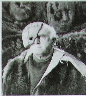
Gwydion a thraean o'r masg.

Doedd hyn, mewn gwirionedd, yn ddim amgen na rhyw brofiad tu chwithig megis o gael torri fy ngwallt ond mai