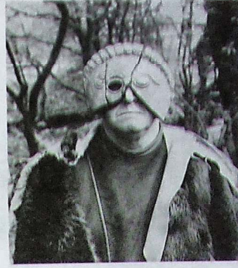
Gwydion a deuddarn o'r masg.