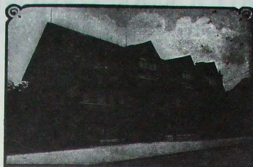
SHAKESPEARE'S HOUSE, STRATFORD-ON-AVON. Per L. & N. W. Railway.

Accident, North British Mercantile, Royal Exchange (gyda'r darlun anochel o'r Royal Exchange yn Llundain), a'r Norwich Union Life yn hysbysebu amryw o eitemau y gellid ar un adeg eu pwrcau'n weddol rad o unrhyw siop fferyllydd).