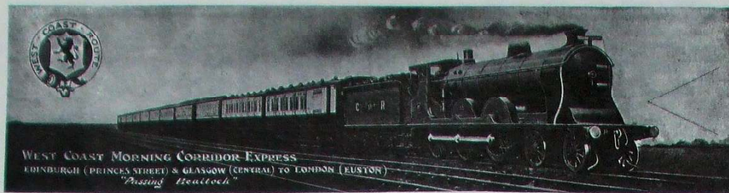
WEST COAST MORNING CORRIDOR EXPRESS EDINBURGH (PRINCES STREET) & GLASGOW (GENERAL) TO LONDON (EUSTON) "Passing Beattock"