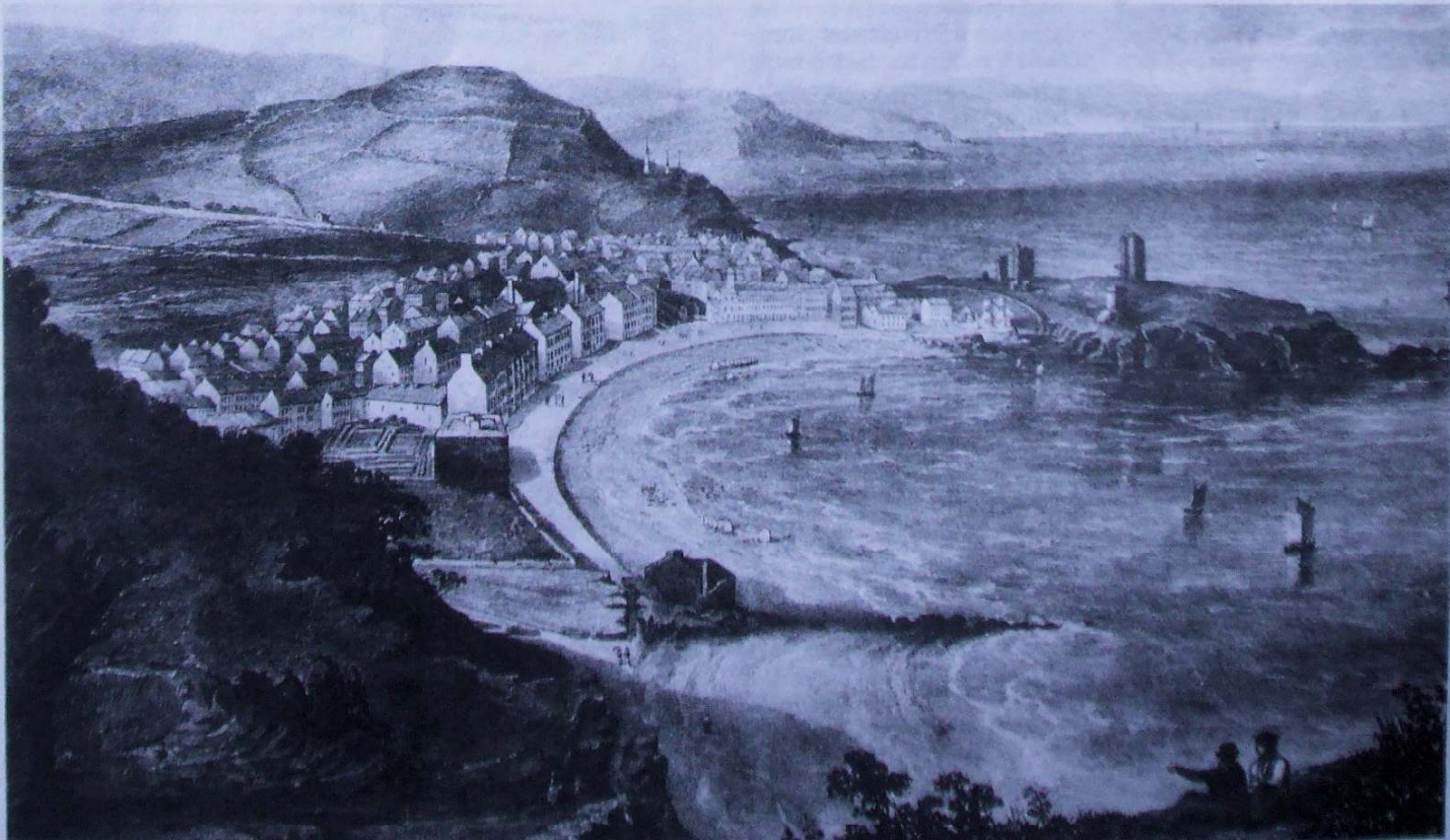
ABERYSTWYTH c. 1850, maint y llun gwreiddiol 13" x 9 1/4".

Tybed ai dyma oedd yn Aberystwyth ond nid oes dim wedi dod i law i brofi hynny ar fap nac mewn dogfen.