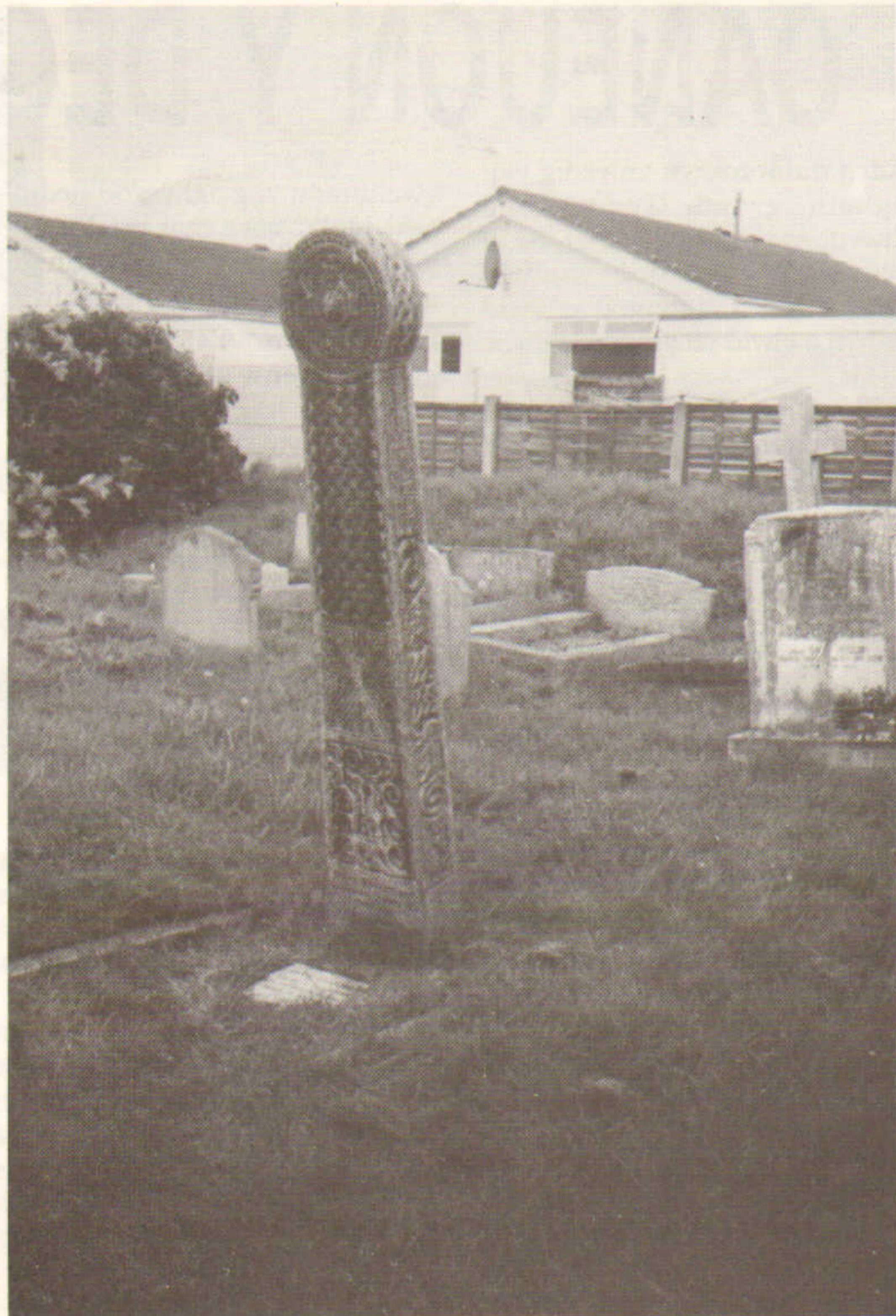
Carreg fedd Owen Rhoscomyl.