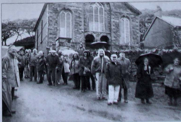
Y fintai wedi cyrraedd Croesor.